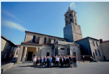
Donateurs pour les travaux de l'église