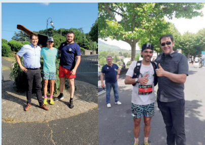
Black Mountain Trail