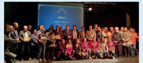
Cérémonie des vœux