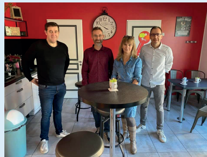
Installation nouveau commerce tabac le Maréchal