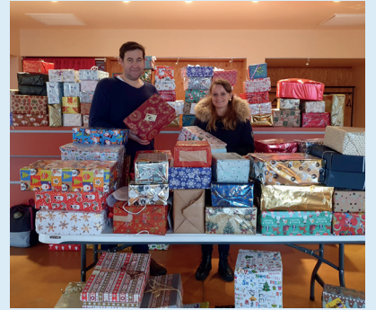
Collecte de colis pour les plus démunis