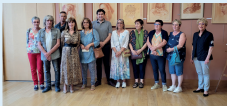
Exposition de l'association culturelle