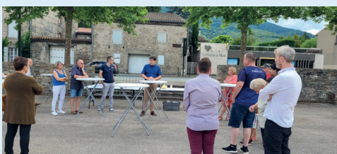
Cérémonie d'accueil des nouveaux arrivants