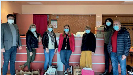
Collecte pour les étudiants