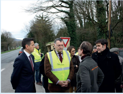
Aménagement carrefour des Raynauds