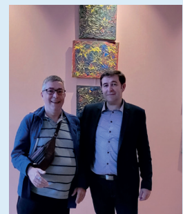
Exposition de Patrick Palak