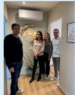
Déménagement Institut O'des Lys