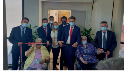
Inauguration de l'EHPAD