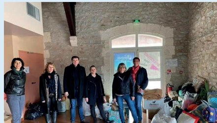
Collecte pour l'Ukraine