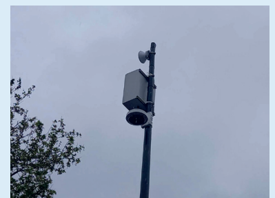
Mise en place de caméras