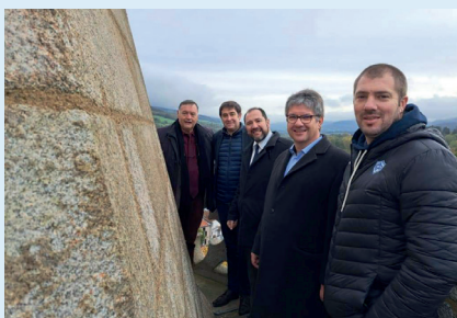
Travaux de l'église