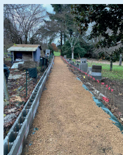
Création d'une voie douce