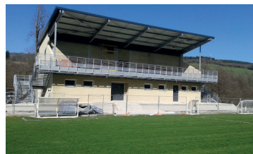
Mise en place d'un tracé pour le rugby sur le stade