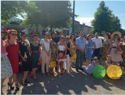
Summer Pin Up Day