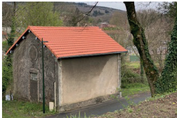
Réfection du toit de la machinotte