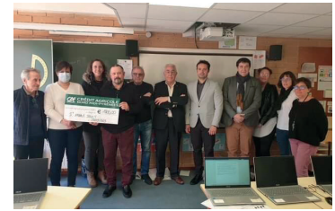
Achat d'ordinateurs pour les élèves de l'Interligne