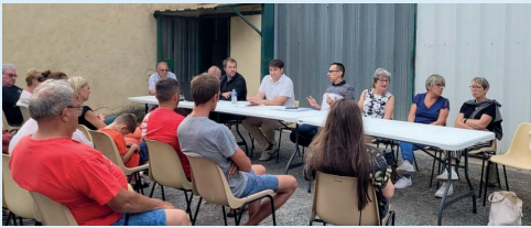
Réunions de quartiers