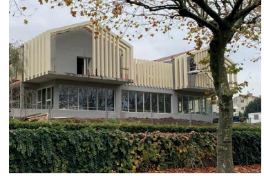
Travaux de l'EHPAD