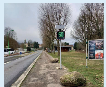
Installation radar pédagogique