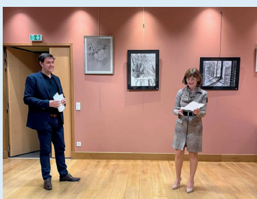
Exposition de Catherine Roques