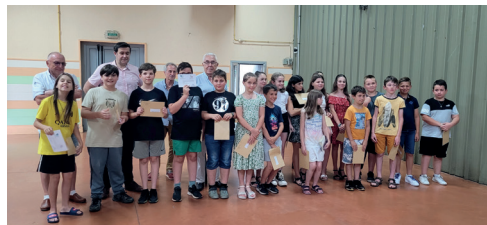
Remise des bons d'achat aux élèves de CM2