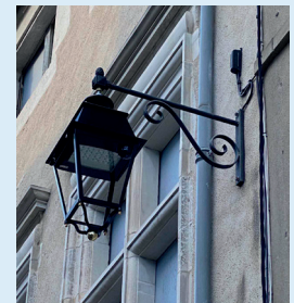
Mise en place des éclairages LED