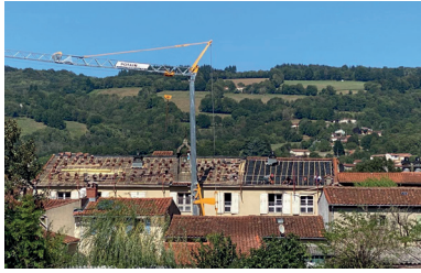
Réfection du toit de l'EHPAD