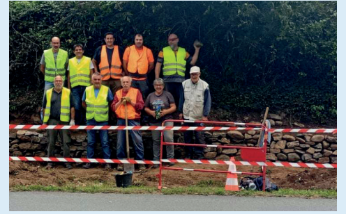
Construction d'un mur en pierres sèches