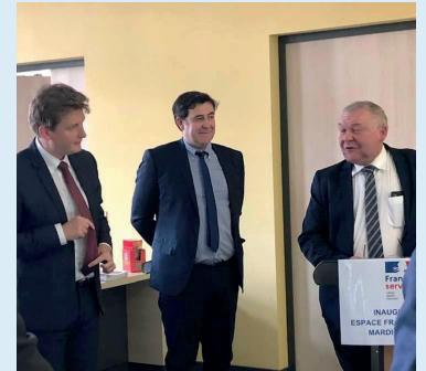
Inauguration France Services