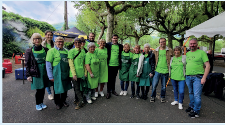
Marché aux fleurs