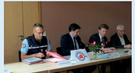
Signature convention citoyenne