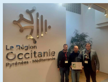
Renouvellement 3 e fleur