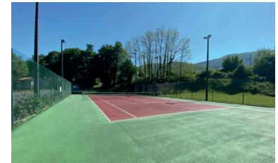
Réfection du cours de tennis