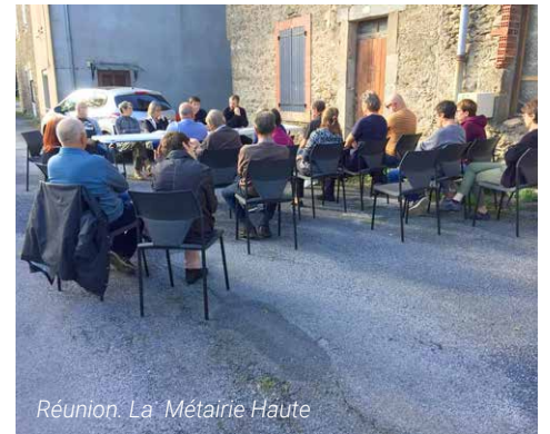
Réunion: La Métairie Haute