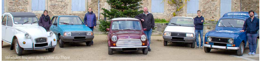
Véhicules Anciens de la Vallée du Thoré

Le quarantième anniversaire est quelque peu perturbé par la crise actuelle qui empêche toute répétition mais